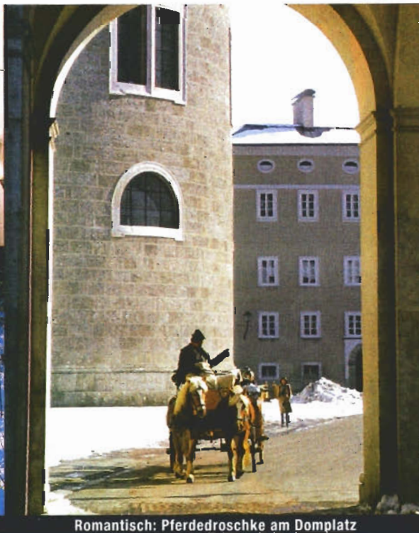
Romantisch: Pferdedroschke am Domplatz