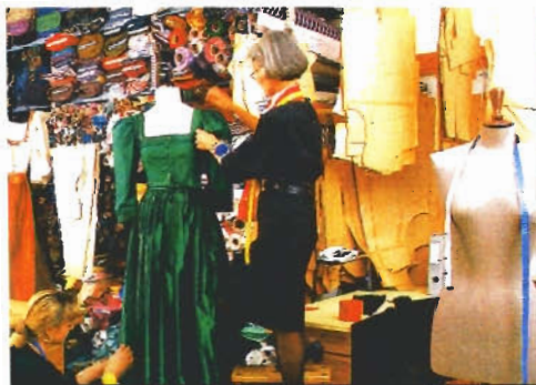
Maßgeschneidert: Trachten von Madl

Telefonvorwahl von Salzburg international 0043/662 Tourismus Salzburg, Auerspergstraße 6, A-5020 Salzburg, Telefon 889870, Fax 8898732, E-Mail tourist@salzburg-info , www.salzburg.info