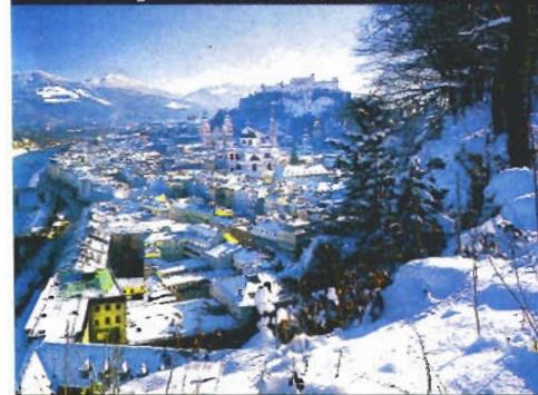
Vogelperspektive: tief verschneite Altstadt

nuss-Nougat. Alter Markt/Brodgasse 13, Tel. 843759.